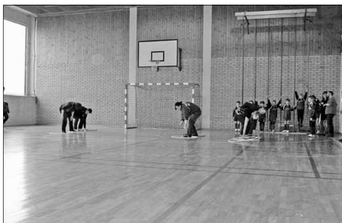
Unsere Eltern in Aktion

Nach diesem aufregenden Wochenende, welches für uns ein voller Erfolg war, sind sich alle einig, dass wir dies im nächsten Jahr wiederholen wollen. So viele glückliche Kinderaugen sind jeden Aufwand wert, den man auf sich nimmt. An dieser Stelle geht unser Dank neben der Wöhlk GmbH, die uns als Sponsor unterstützt hat, an alle Eltern, ohne deren aufopferungsvolle Unterstützung das Fußballwochenende nicht umsetzbar gewesen wäre. Der reibungslose Ablauf aller Turniere war Ausdruck der super Zusammenarbeit zwischen den Mannschaften und den Eltern unserer Fußballkinder.