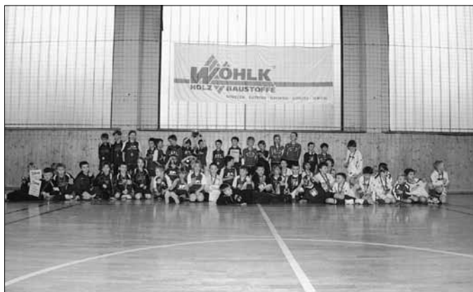
Gruppenbild der teilnehmenden Mannschaften

Die F- und die G-Junioren spielten ein Doppeltturnier mit je 4 Mannschaften. Wir luden uns hierbei Mannschaften ein, gegen die wir nicht so häufig spielen und freuten uns dabei besonders, dass wir mit der SG Oßling-Skaska eine Mannschaft aus dem Kamenzer Bereich begrüßen konnten.