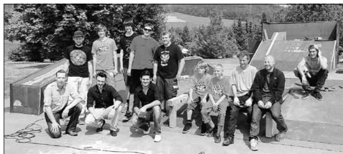
Wilthens Skatercrew - Umbau eines Elements auf dem Skaterplatz

Aktuelle Bilder vom Aktionswochenende finden sich unter www.48h-sachsen.de