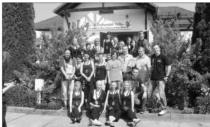
Tanz- und Theaterwerkstatt Wilthen - Kinderfest zum Vereinsjubiläum