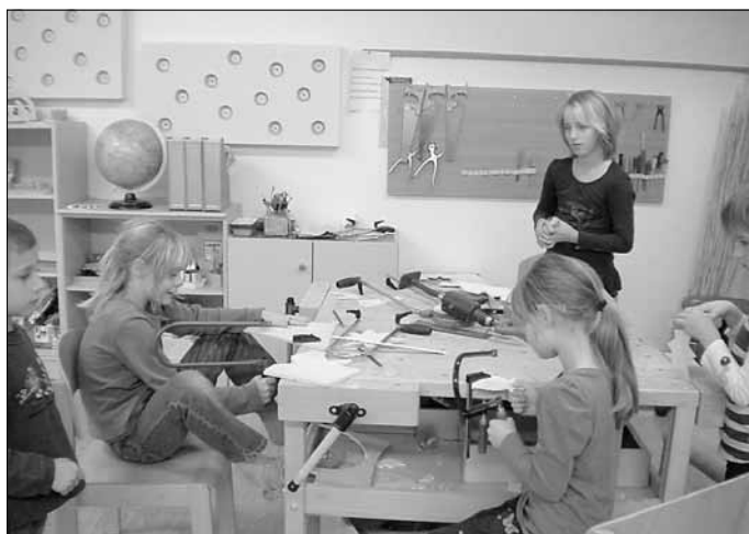
Hortkinder im Werk- und Bastelraum