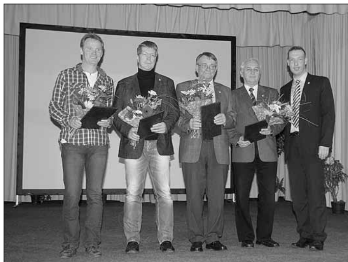
Mit dem Ehrenzeichen der Stadt Wilthen wurden vier aktive Vereinsvorsitzende geehrt.