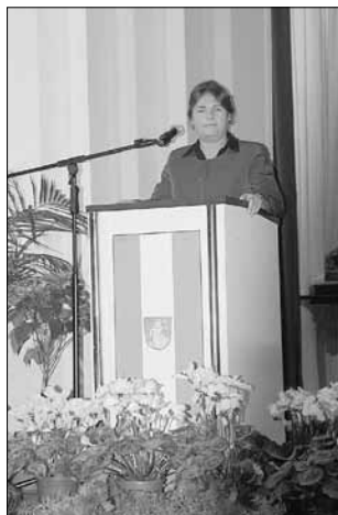
Maria Michalk, Mitglied des Bundestages

Der Einladung des Bürgermeisters folgten wieder zahlreiche Gäste aus Politik, Wirtschaft, Vereinen, den Kirchen, den Schulen, der Presse und unserer polnischen Partnerstadt Lwowek Slaski (Löwenberg).