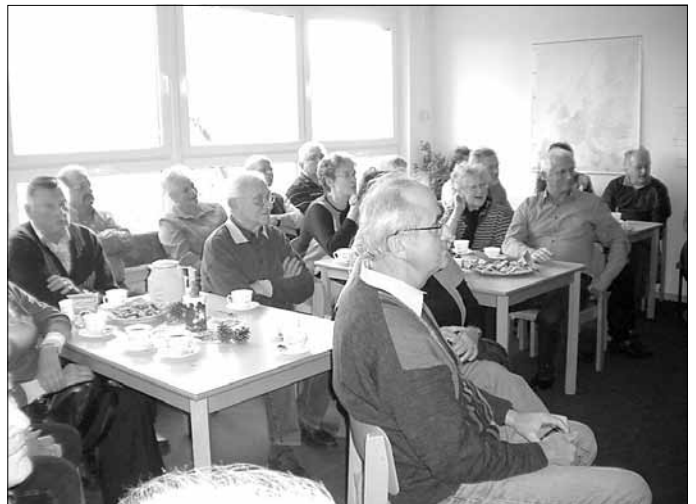
Oma- & Opanachmittag im Hort