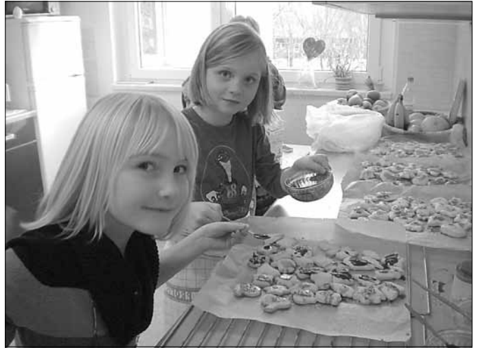
Beim Plätzchenbacken in der Hortküche

„Wir sind die Kinder vom Spatzenchor, ja unsere Lieder die geh'n ins Ohr.“