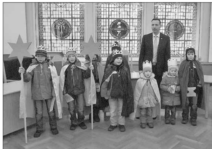
Die Sternsinger mit Bürgermeister Herfort im Wilthener Rathaus.

Ihre Gemeindereferentin - Jacqueline Gabener