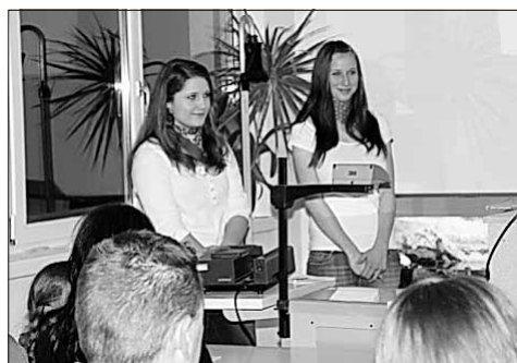
An dieser Stelle veröffentlichen wir ein paar Bilder von unserem Abend.